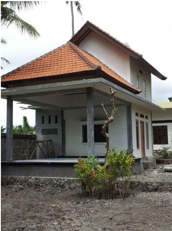
Küche (mit Lagerraum für Reis im ersten Stock)