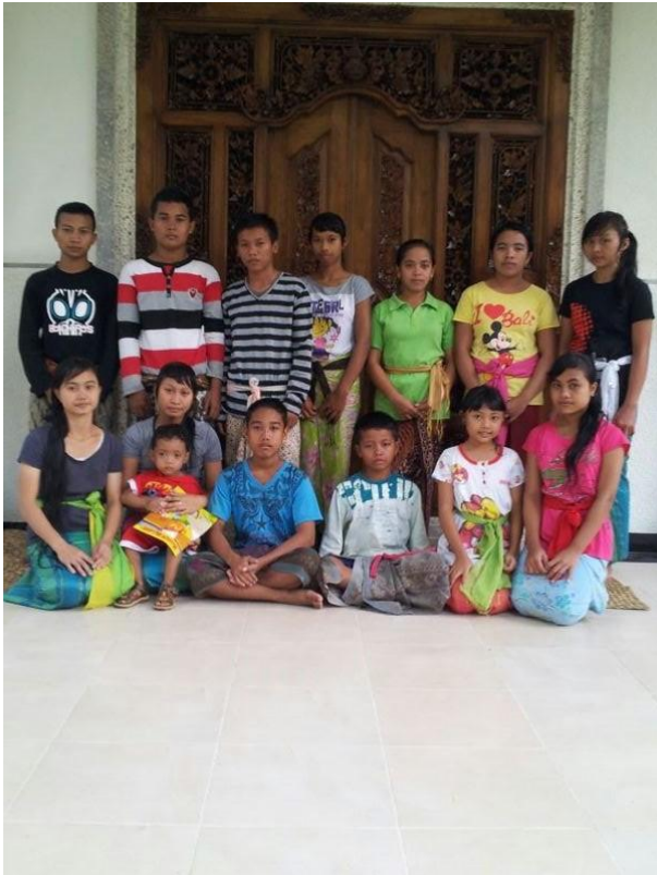
Die Sadar Jugend vor dem Eingang des neuen Gebäudes