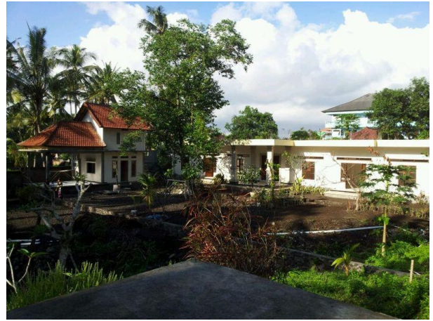
Küche und Jugendhaus

Es ist soweit. Wie freuen uns, Ihnen einige Bilder des neu erstellten Jugendhauses von Sadar Foundation in Bali zeigen zu können. Mit einer kleinen hinduistischen Zeremonie wurden die Gebäude am 22. Juli bei Vollmond geweiht und zum Bezug freigegeben. Die Umzugsarbeiten sind voll im Gange und 7 Mädchen und 5 Jungen ziehen nun ins neue Haus ein.