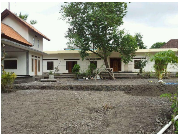
Jugendhaus (links vom Baum leben die Knaben, rechts die Mädchen)